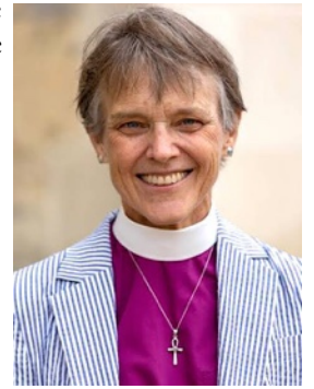
MARIANN EDGAR BUDDÉ,

Il semblerait qu'une seule voix officielle discordante se soit élevée contre le programme politique de discrimination et de ségrégation de Donald Trump, celle de Mariann Edgar Budde, évêque épiscopalienne, lors de son sermon dans la cathédrale de Washington. Devant un parterre de trumpistes, mâles blancs aux épouses stéréotypées, elle s'est adressée à Trump pour plaider pour les personnes gay, lesbiennes, transgenres des familles américaines, pour les immigrés mis en danger par les mesures agressives mises en place. Cela a soulevé le courroux du nouveau président.