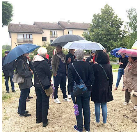
SAMEDI 22 JUIN rencontre au Clos Dormoy avec Benjamin Lambert candidat du Nouveau Front populaire dans la 1ère circonscription de Haute-Marne. Notre syndicat était présent.

La réunion du 27 juin avec la DDT concernant les engagements de Chaumont Habitat pour la résidence Victor Hugo sera détaillée dans notre prochain journal