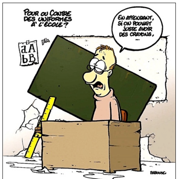
Dessin de Babouze paru dans l'Humanité