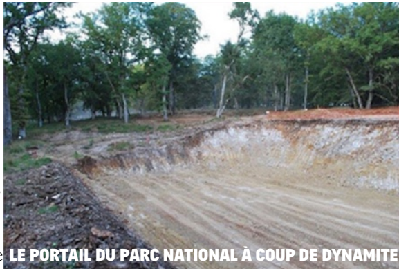
LE PORTAIL DU PARC NATIONAL À COUP DE DYNAMITE

Le scandale au plan écologique se double d'un scandale financier puisque le Conseil départemental aura déboursé plus de 11 millions en études diverses et travaux d'aménagement variés. Est-il nécessaire de rappeler à nos élus que ces 11 millions sont payés par nos impôts, que c'est de l'argent public et qu'il ne doit pas servir à engraisser des sociétés ou des « responsables » de projet qui n'ont que faire de l'avenir du département... Maintenant, le département va devoir payer la remise en état du Parc aux daims.