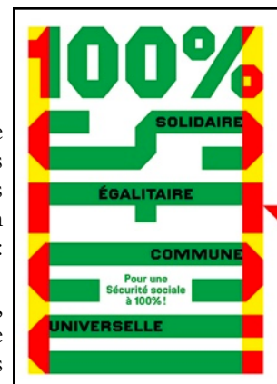
AFFICHE DE SÉBASTIEN MARCHAL

https://www.frustrationmagazine.fr/supprimer-