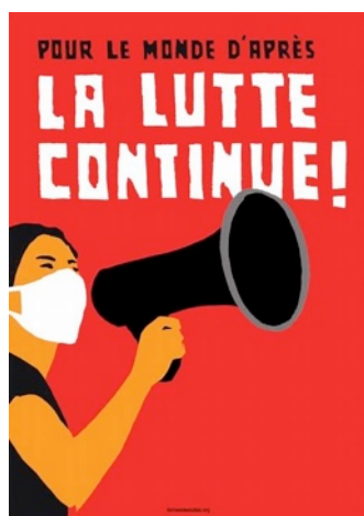
VISUEL DU COLLECTIF "FORMES DES LUTTES"