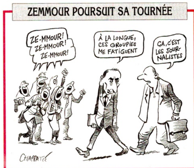
Dessin paru dans le Canard Enchaîné