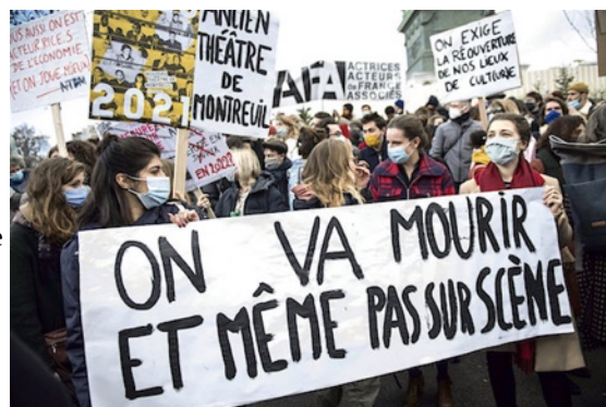
15 DÉCEMBRE 2020. MOBILISATION DE LA CULTURE

*Avec le concours de Molière pour le titre, de la fédération du spectacle CGT et du journal l'Humanité