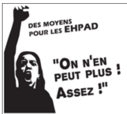
Affichette vue dans les manifs à Chaumont au second trimestre de 2019

Chaumont - 14 avril 2020 Syndicat CGT des retraités de Chaumont