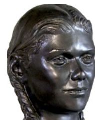
Jean-Claude DESPOULAIN Buste de jeune fille