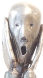
Michel BOUSSARD Le Cri (d’après Munch)