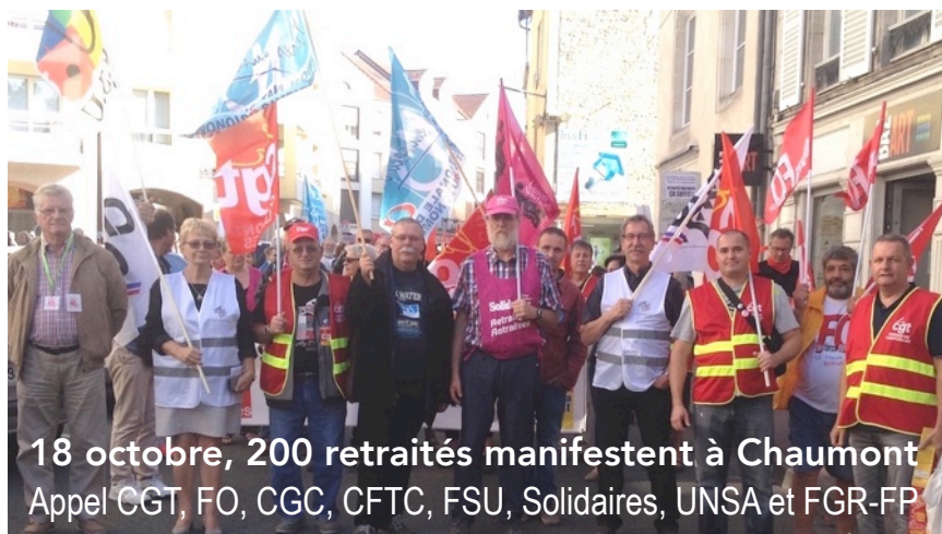
18 octobre, 200 retraités manifestent à Chaumont Appel CGT, FO, CGC, CFTC, FSU, Solidaires, UNSA et FGR-FP

https://www.dailymotion.com/video/x1bz86z